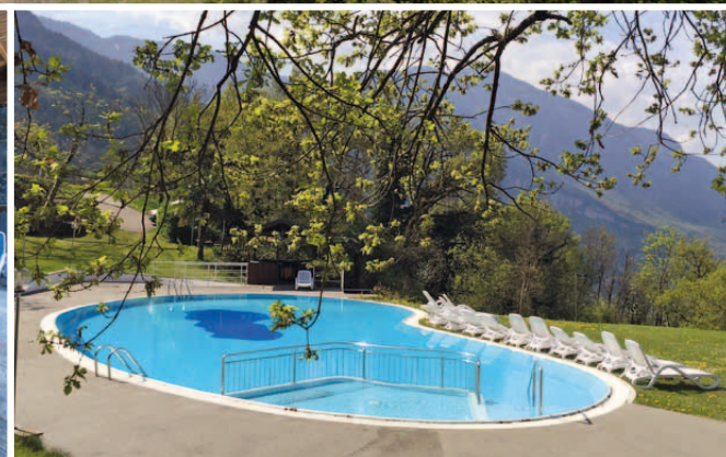
Oase der Ruhe Oasi del riposo Oasis of tranquility